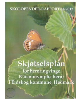
Bilde 2 Skolopender- rapport 01-2012

Miljøregistreringer i skog (MiS) er gjennomført på det aller meste av den produktive skogen i Eidskog. Da hovedtakseringen var gjennomført i 2009 var drøyt 337 000 dekar registrert. Noen eiendommer har kommet til i etterkant.