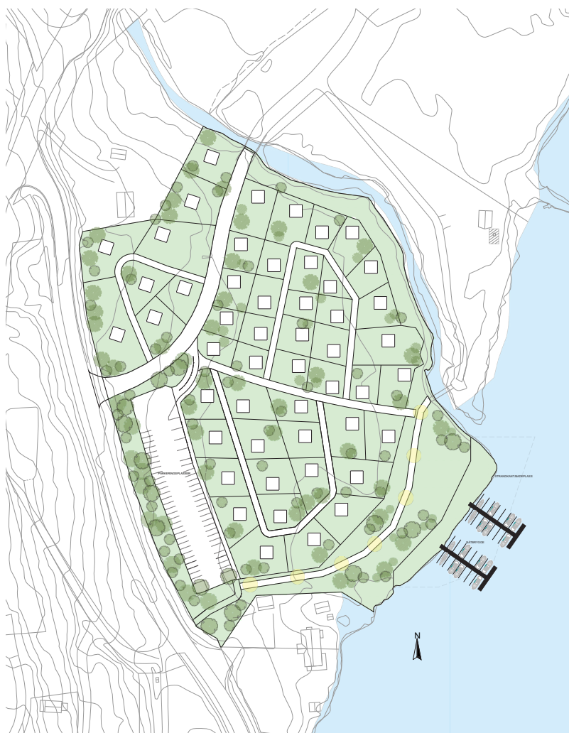
Illustrasjon av planområdet (Se vedlegg for detaljregulering)

I henhold til plan- og bygningsloven §§ 17-4 og 12-8 kunngjøres oppstart av planarbeid for Brustadvika i Eidskog kommune. Planarbeidet utføres av Hauer Husplan AS på vegne av Towi Holding AS.