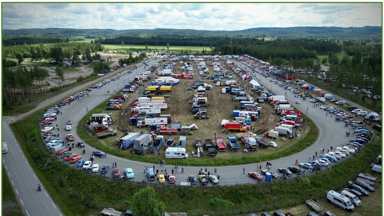
Foto: Veterandagene på Magnor Travbane 2022 - Lions Club Eidskog

Vil du være frivillig eller finne informasjon om frivillige lag og foreninger?