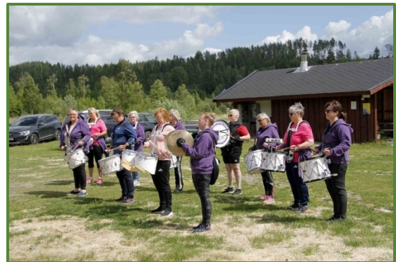
Takt skar du ha

Frivilligheten har fått mulighet for medvirkning gjennom skriftlige innspill. Samtidig er det gjennom 2021/2022 avholdt dialogmøter og workshop, som også har bidratt til frivilligstrategiens innhold.