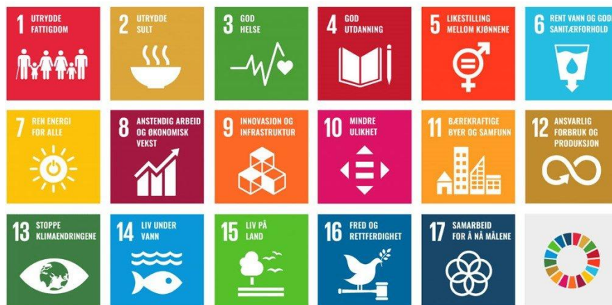
Figur 2 FNs bærekraftsmål

Eidskog ønsker å sett spesielt fokus på bærekrafts mål 8; «anstendig arbeid og økonomisk vekst» og bærekraftsmål 17; «samarbeid for å nå målene» Kommune har et svært begrenset økonomisk handlingsrom i den neste 4- årsperioden, det er derfor ekstra viktig at planarbeidet er med på å bygge en god samarbeidskultur i kommunen. Samtidig er flere av FNs bærekraftsmål sammenfallende med hvordan f.eks. kommuner likevel har jobbet. Gjennom tiltak for å sørge for et sosialt sikkerhetsnett, best mulig barnehage og skolegang, helsetjenester som dekker hele livsløpet og god infrastruktur er dette ikke noe nytt.